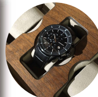
時計収納イメージ