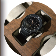
時計収納イメージ